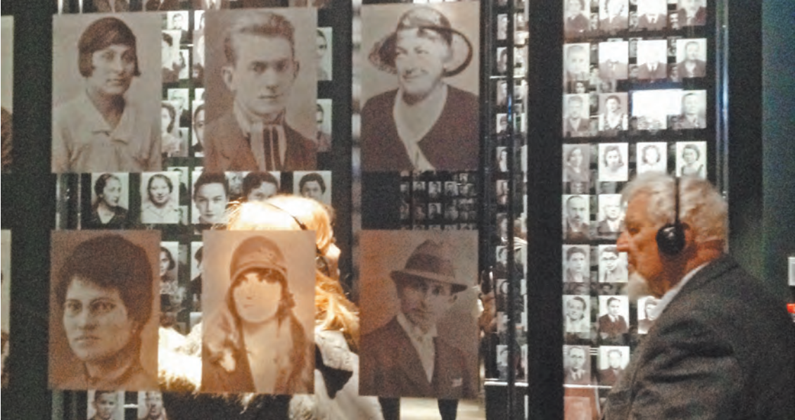
Создатели музея попытались рассказать, как война отразилась на жизни обычных людей в разных странах мира.

третьем этаже. Ее встречают растерянные кассиры. Шутка ли — устраивались работать в спокойное и культурное место, а приходится обслуживать тысячи посетителей, да еще и не обходится без вечерних скандалов: «Как это закрываешься? Мы специально приехали из Эльблонга и полдня простояли, чтобы попасть в ваш музей!» На вопрос корреспондента «РГ» к участникам этой очереди: «За чем стоим?» — отвечают: «Успеть увидеть «нережимную» экспозицию!» Экспозиция находится в специально построенном помещении площадью более 5 тысяч квадратных метров на глубине 15 метров под землей. По этой причине некоторые особенно крупные экспонаты устанавливали на этаже строительства.