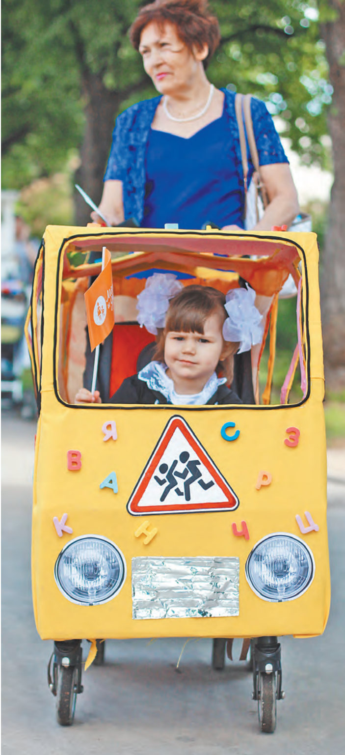
Няни должны будут получать лицензии на свою деятельность.

По моим данным, сейчас 1,5 миллиона самых маленьких россиян в возрасте до трех лет нуждаются в яслях». Дефицит, по его словам, в яслях есть даже в столице. Проблема частично решается за счет так называемых групп кратковременного пребывания при детских садах. Но там ребенок может находиться максимум пять часов в день. Понятно, что мамам, которым нужно выйти на работу как можно быстрее после родов, это неудобно, поэтому и приходится искать помощницу (как правило, нянями работают сегодня женщины). И платить им большие деньги. По данным агентств, предоставляющих услуги нянь, минимум, что придется заплатить в месяц, — это 30 тысяч рублей. Да и то такие расценки существуют в средних по численности населения городах. В мегаполи-