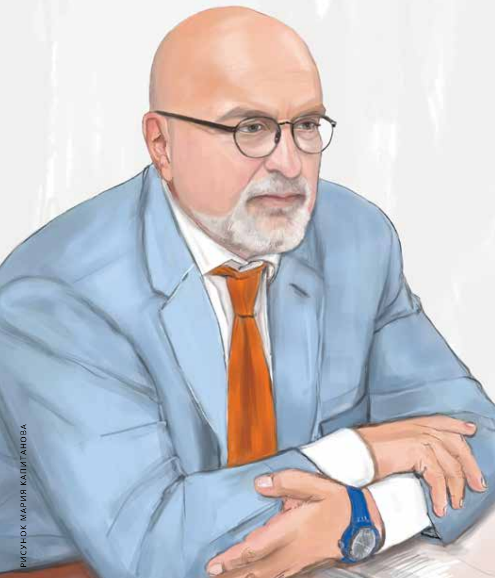
РИСУНОК МАРИЯ КАПИТАНОВА