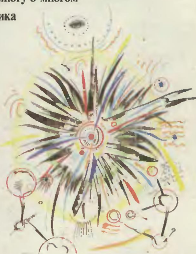
Обложка Ю. Сарафанова. Это — вариация на темы В. Кандинского и компью- терных сценариев разви- тия Вселенной. Читайте в номере статью А. Семе- нова «Вселенная по Кан- динскому».