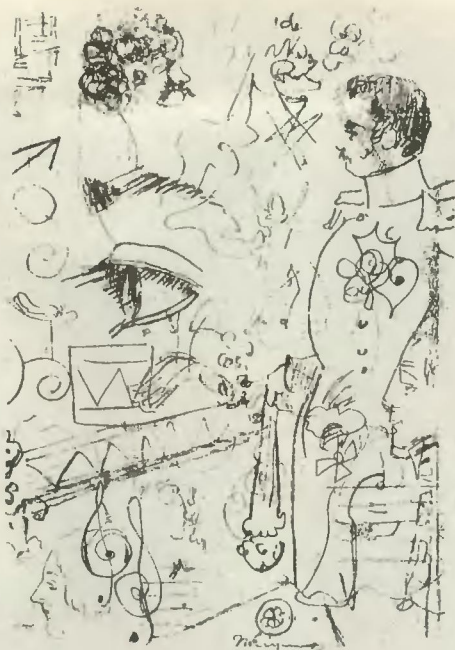
Фрагмент рисунка П. Федотова