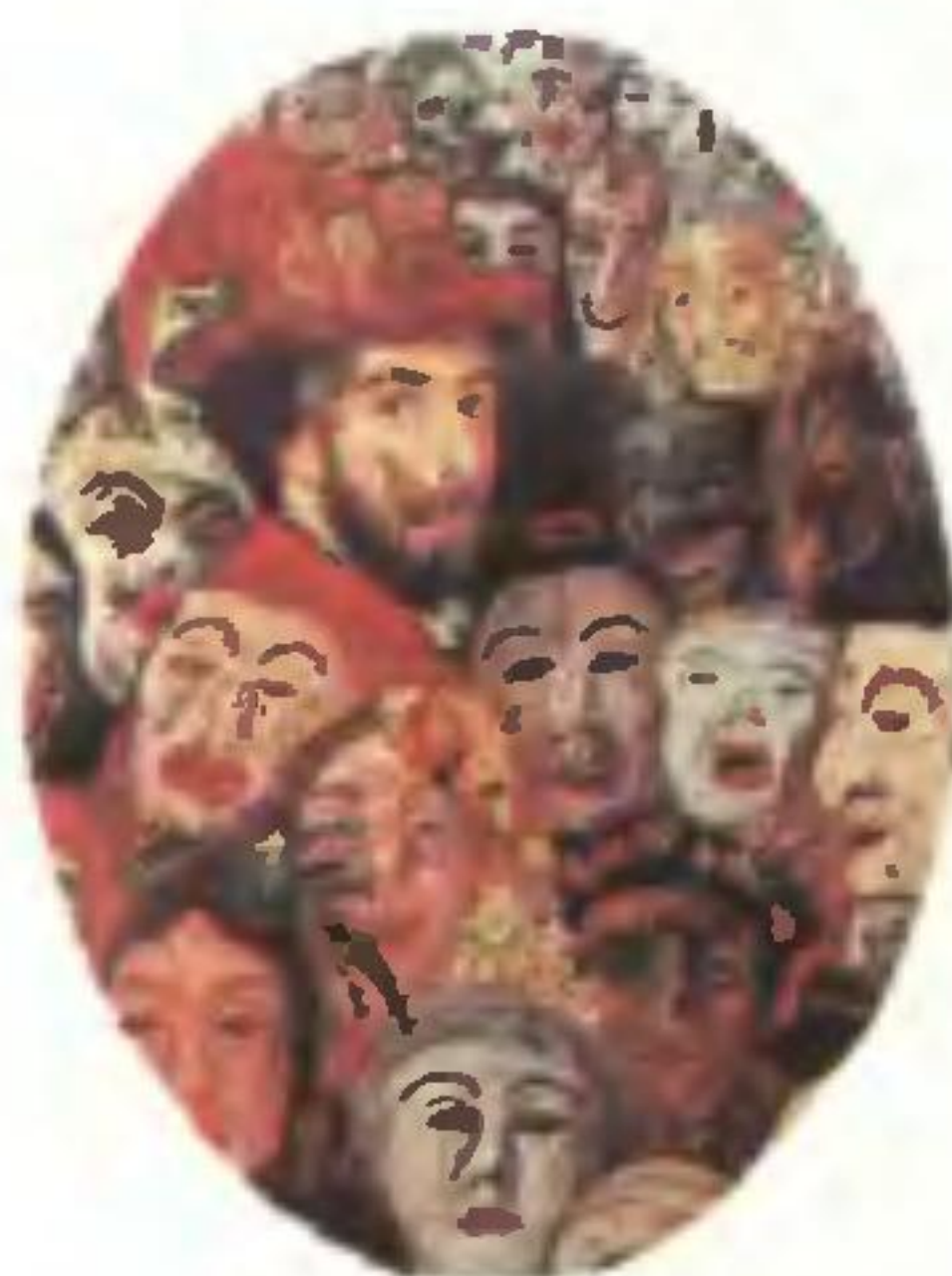
Д. Энсор. «Художник с масками вокруг него», фрагмент