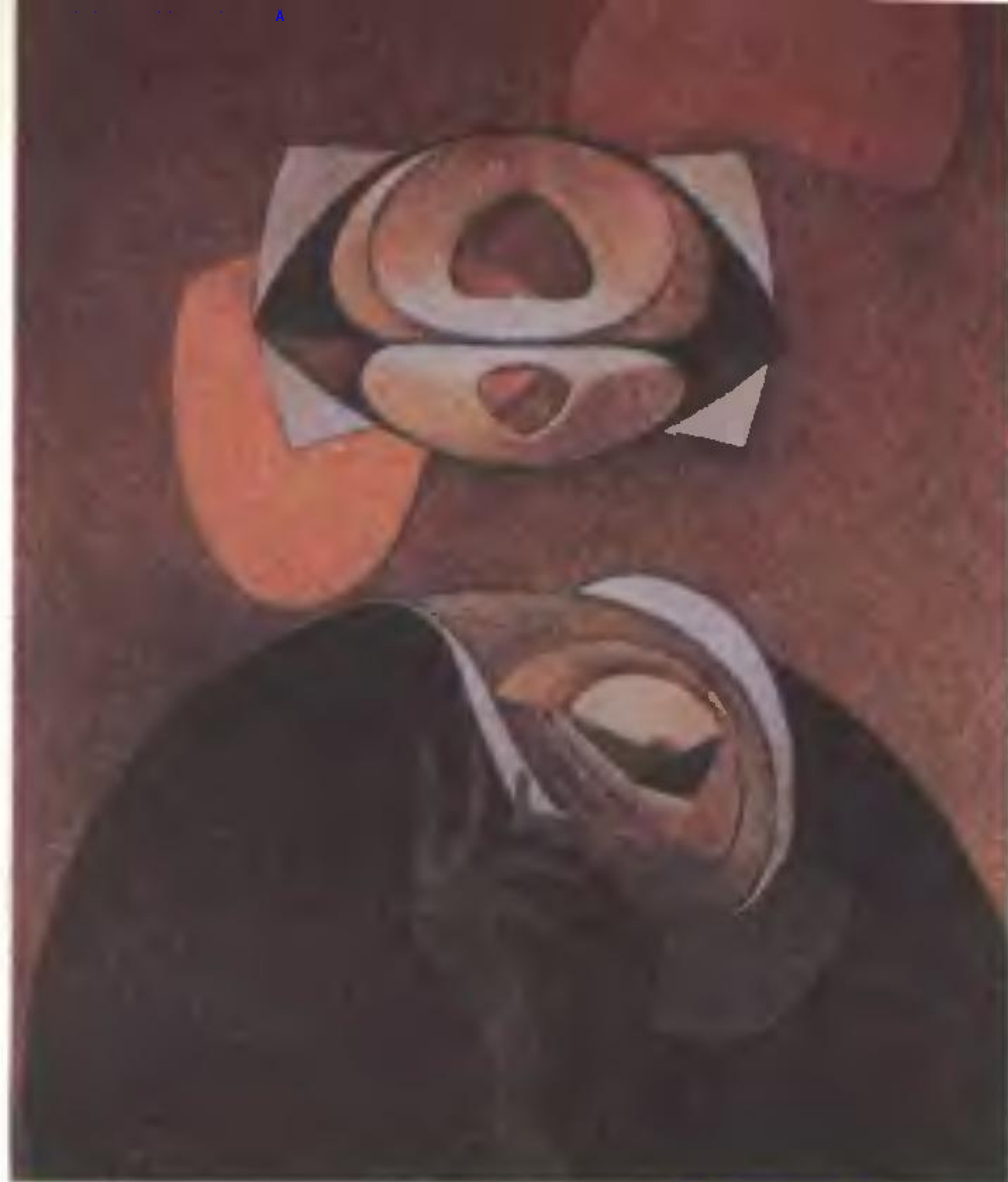
Макс Эрнст. «Португальская религия»