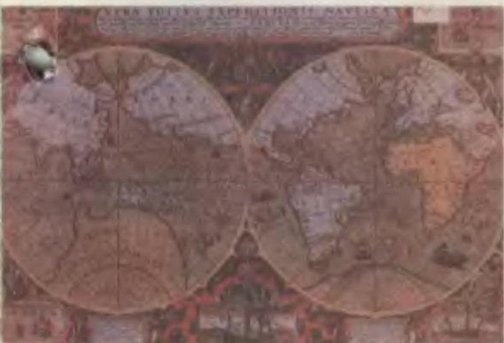
Географическая карта с кругосветным путешествием Дрейка, 1589 год