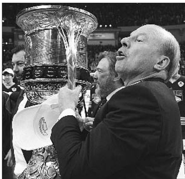
Майк КИНЭН стал первым иностранным тренером, выигравшим Кубок Гагарина. Кто бросит канадцу перчатку?

1. Чего в предстоящем сезоне вы ожидаете больше всего - новых правил, потогонного календаря без пауз на этапы Евротура, звезд соперника или чего-то еще?