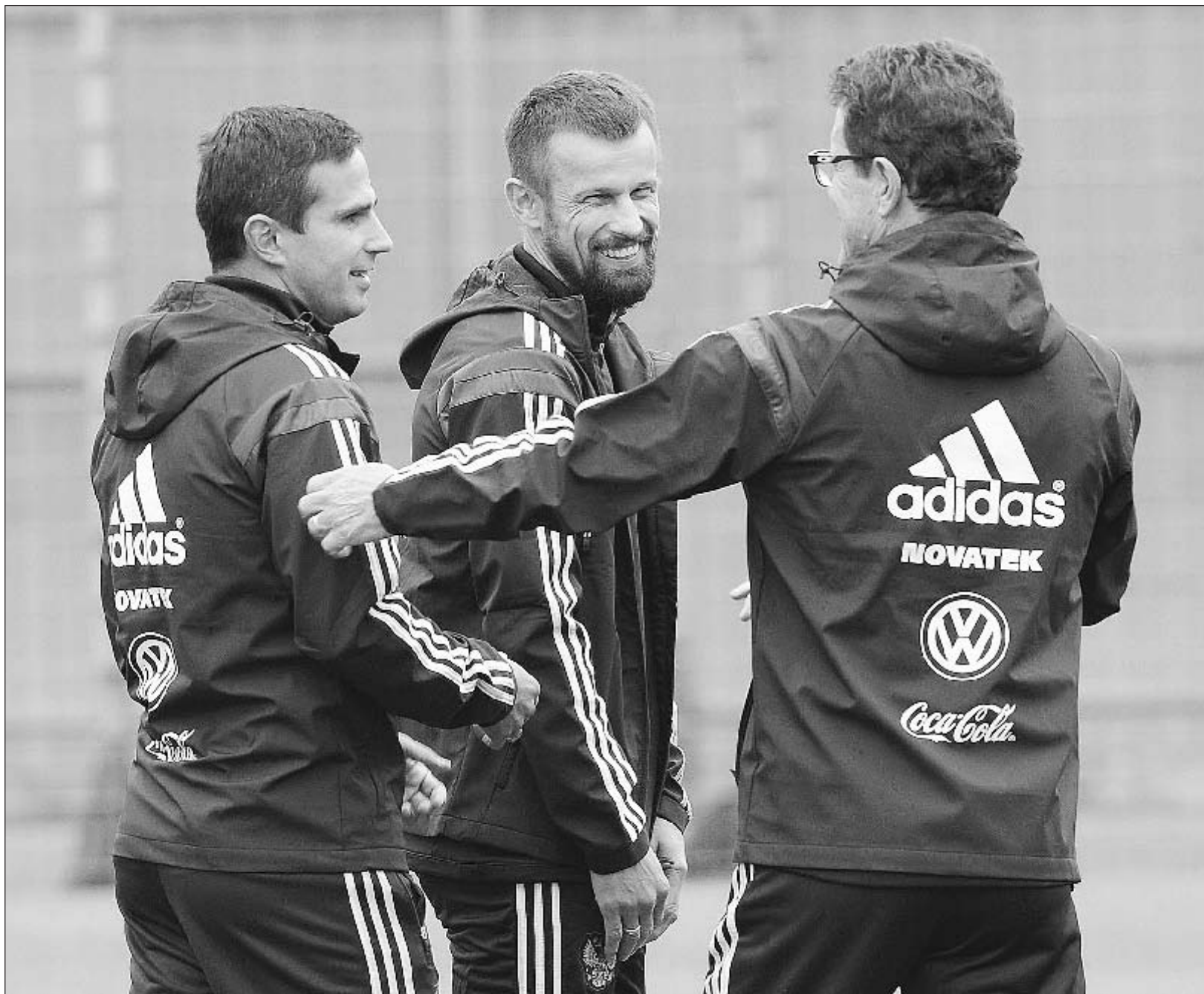
Вчера. Новогорск. Тренировка сборной России. Фабио КАПЕЛЛО со своими новыми помощниками - Игорем СИМУТЕНКОВЫМ и Сергеем СЕМАКОМ.

Вчера сборная России провела первую тренировку после возвращения из Бразилии с чемпионата мира. В команде появились новые игроки, занятие окружали новые пейзажи, а в штаб вошли новые специалисты - россияне Сергей Семак и Игорь Симутенков.