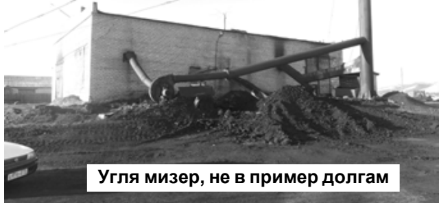
Угля мизер, не в пример долгам