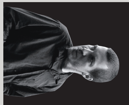
КОЛЛАЖ: СЕРГЕЙ ЖЕГЛО

Мы почти ничего не производим, и поэтому мы — потенциально очень бедная страна. Пока у нас был доступ к дешевому импорту, это можно было не замечать, но как только импорт стал исчезать — стал дорогим (девальвация), его не на что покупать (падение стоимости экспорта), уровень наших реальных доходов начал приближаться к уровню производимой нами самими внутри страны добавленной стоимости. Если считать совсем упрощенно, то в предельном случае, чтобы мы сами могли обслуживать свое потребление, уровень доходов должен снизиться на 30–40%