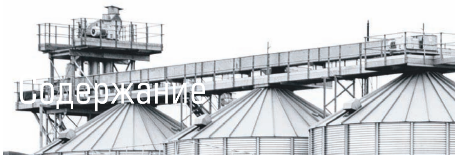
ОБЛОЖКА: СЕРГЕЙ ЖЕГЛО