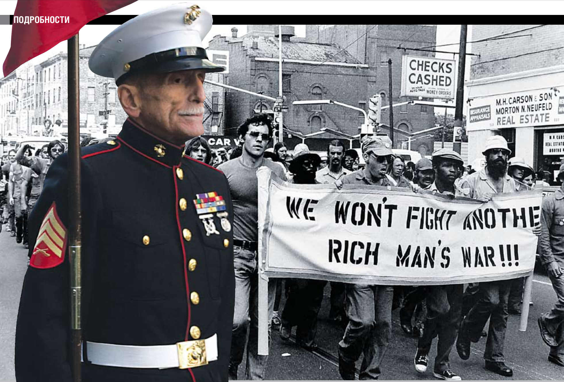
Коллаж Андрея СЕДУХА