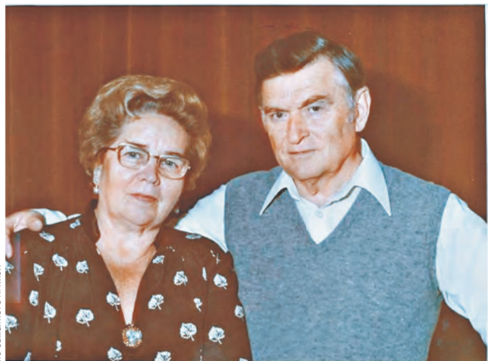
Кирилл Мазуров и его супруга воспитали троих детей. И когда все они съезжались в родительский дом — это были самые счастливые часы.

Как много в современном мире политиков. Но государственных деятелей, которые знают, что надо стране завтра, — единицы. Хорошо, что они есть и у России, и у Беларуси.