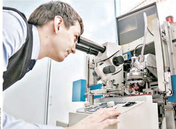
Сделанные на «Планаре» установки не уступают лучшим мировым образцам, а стоят в разы дешевле.