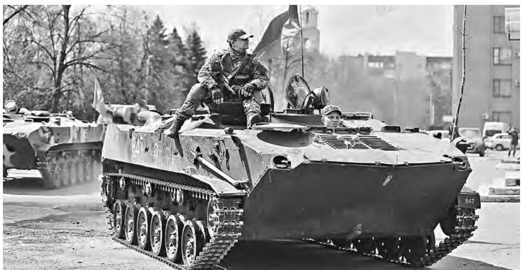
На сторону ополченцев в Славянске перешло уже около 60 украинских военных вместе с боевой техникой.