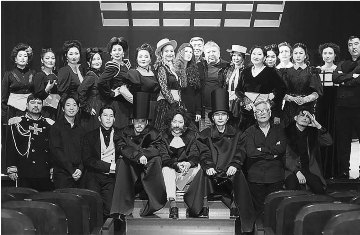
Постановка национального театра Калмыкии вошла в номинанты премии «Золотая маска». Спектакль «Горе от ума» режиссера Бориса Манджиева представлен сразу в пяти номинациях. Известие вдохновило коллектив на новые творческие победы.