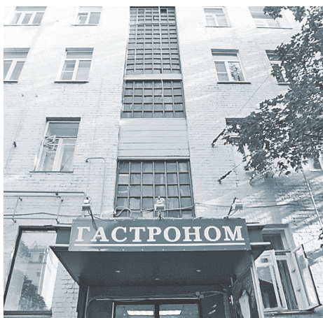
Торговые точки малого бизнеса в основном находятся на первых этажах.