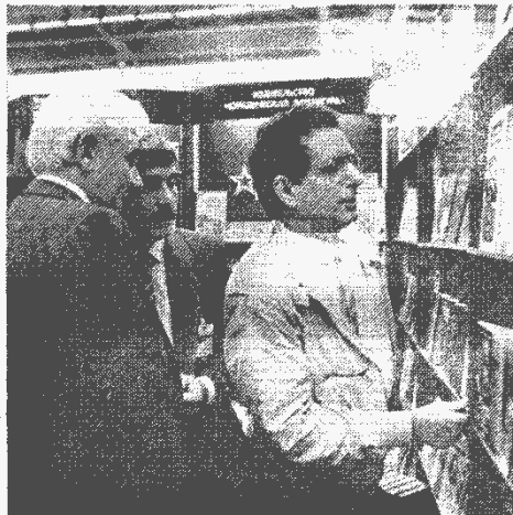
У стендов выставки