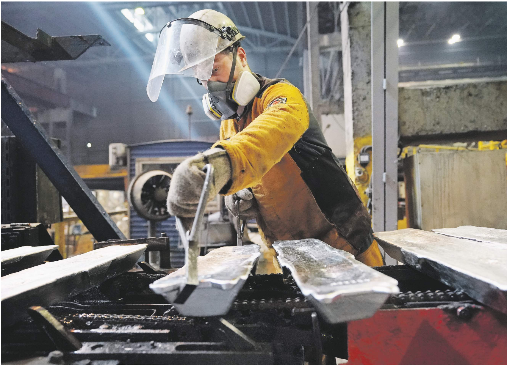
Тариф Воронов / Известия