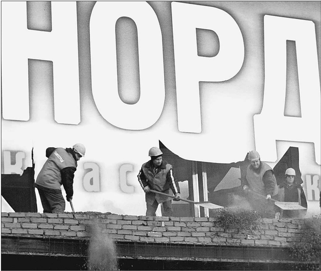
8 ноября 2002 г. Москва. Ремонтные работы в Театральном центре на Дубровке

● ЦИТАТА ДНЯ «Опыт учит нас, что умирают всегда другие». Станислав СЛОНИМСКИЙ, польский врач