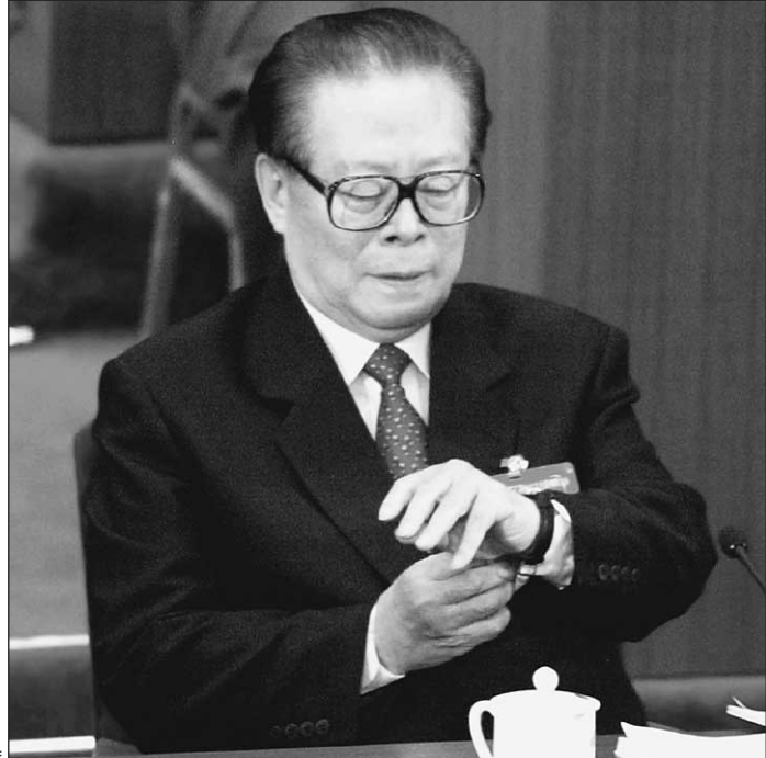
Председатель КНР Цзян Цзэминь готовится уйти в отставку