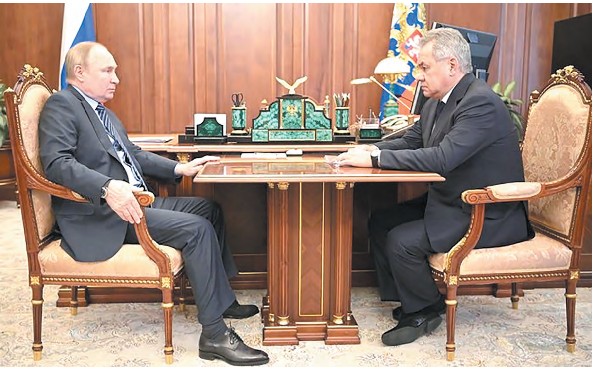
Об итогах первой миротворческой операции сил ОДКБ министр обороны РФ генерал армии Сергей Шойгу доложил Верховному Главнокомандующему Президенту России Владимиру Путину

По словам министра обороны, именно за счёт высокого темпа операции удалось в первые же дни высвободить порядка 1600 сотрудников силовых структур Казахстана, которые активно включились