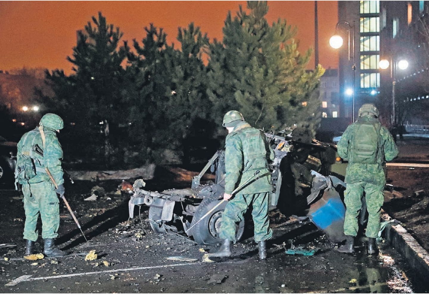
Взрыв автомобиля в центре Донецка глава самопровозглашенной ДНР Денис Пушилин счел диверсией в рамках подготовки украинской стороны к наступлению

А в 19:00 (время совпадает с московским) в городе прогремел мощный взрыв, который слышал едва ли не весь город. Взорвался автомобиль начальника Народной милиции ДНР Дениса Синенкова, припаркованный возле здания дома правительства. Комментируя произошедшее, власти призвали граждан «сохранять спокойствие, быть бдительными, а также исключить по максимуму передвижение по городу». А Денис Пушилин констатировал: речь идет о диверсии в рамках подготовки украинской стороны к наступлению.