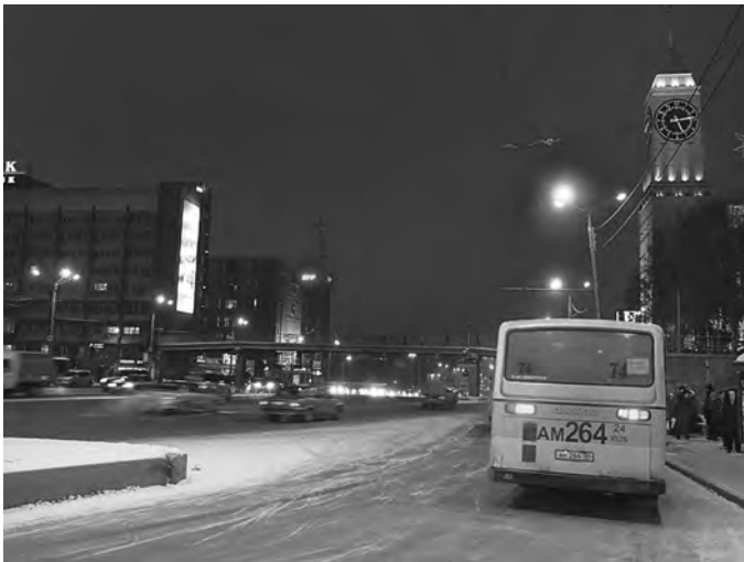
Пробки на красноярских магистралях рассасываются только поздним вечером.