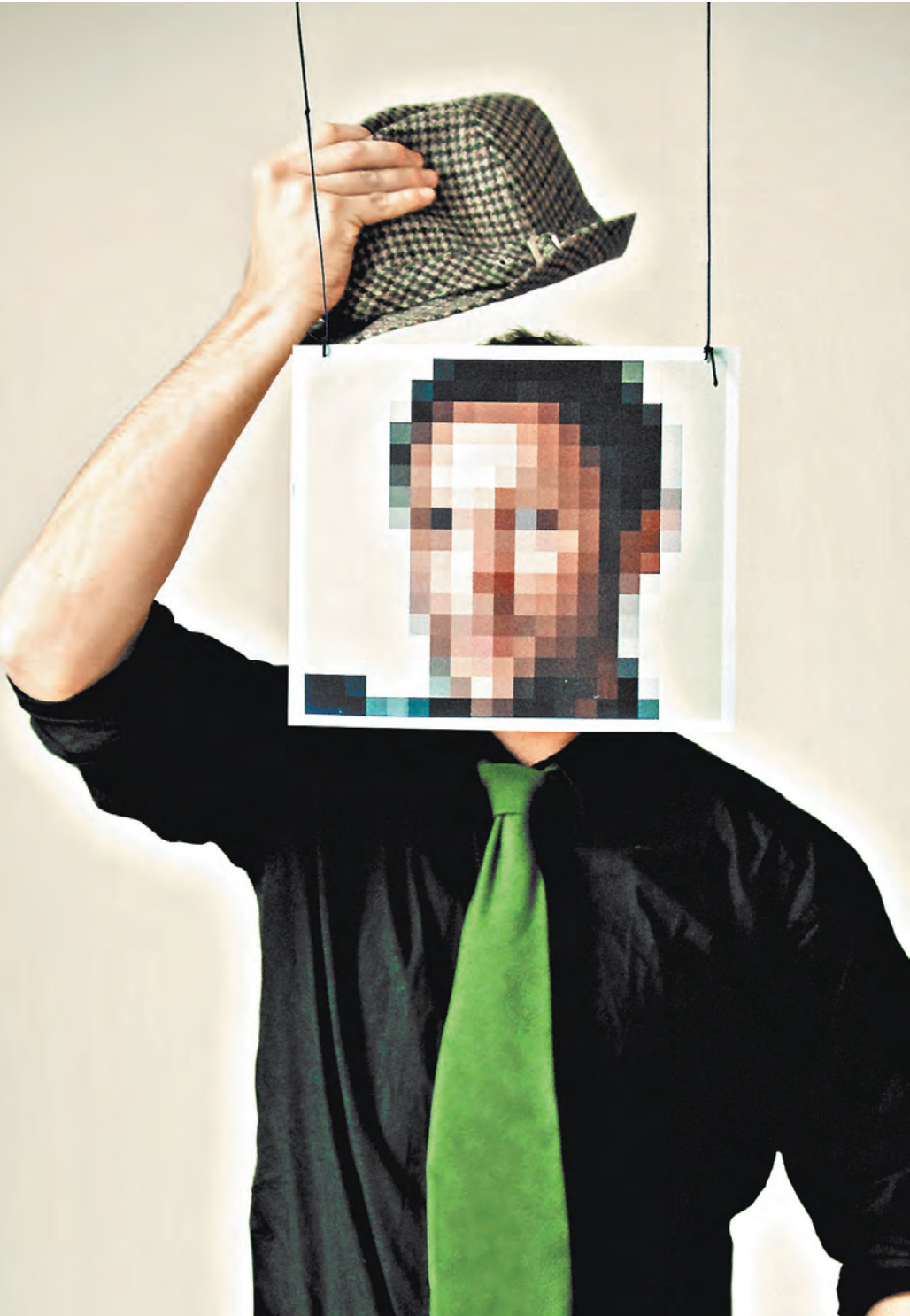
Россияне смогут накладывать вето на использование своих персональных данных.

Используя эту систему, гра- жданин сможет давать согласие на обработку его персональных данных конкретным оператором и отозвать согласие.