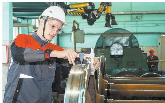
«ОМК СТАЛЬНОЙ ПУТИ»

Взаимодействие | В понедельник ОАО «РЖД» и вагоноремонтная компания «ОМК Стальной путь» подписали соглашение о сотрудничестве: партнёры будут вместе повышать уровень безопасности на железнодорожной сети, улучшая качество ремонтов. Подобный документ является первым в отрасли.