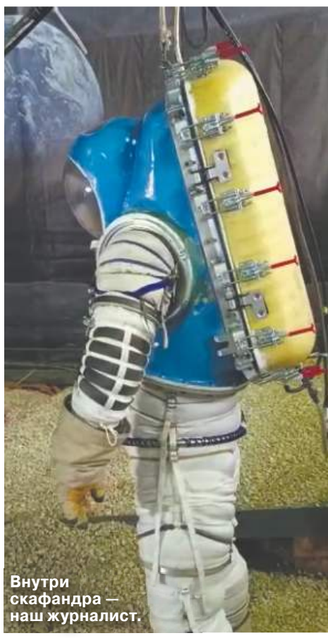
Внутри скафандра — наш журналист.

погулять на экспериментальной площадке научно-производственного предприятия «Звезда» в прототипе лунного скафандра. Это была своеобразная открытая «премьера» защитного