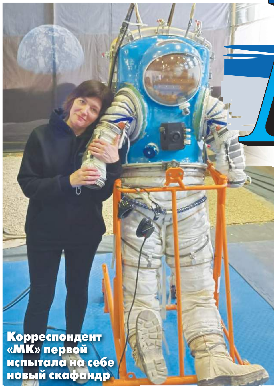
Корреспондент «МК» первой испытала на себе новый скафандр