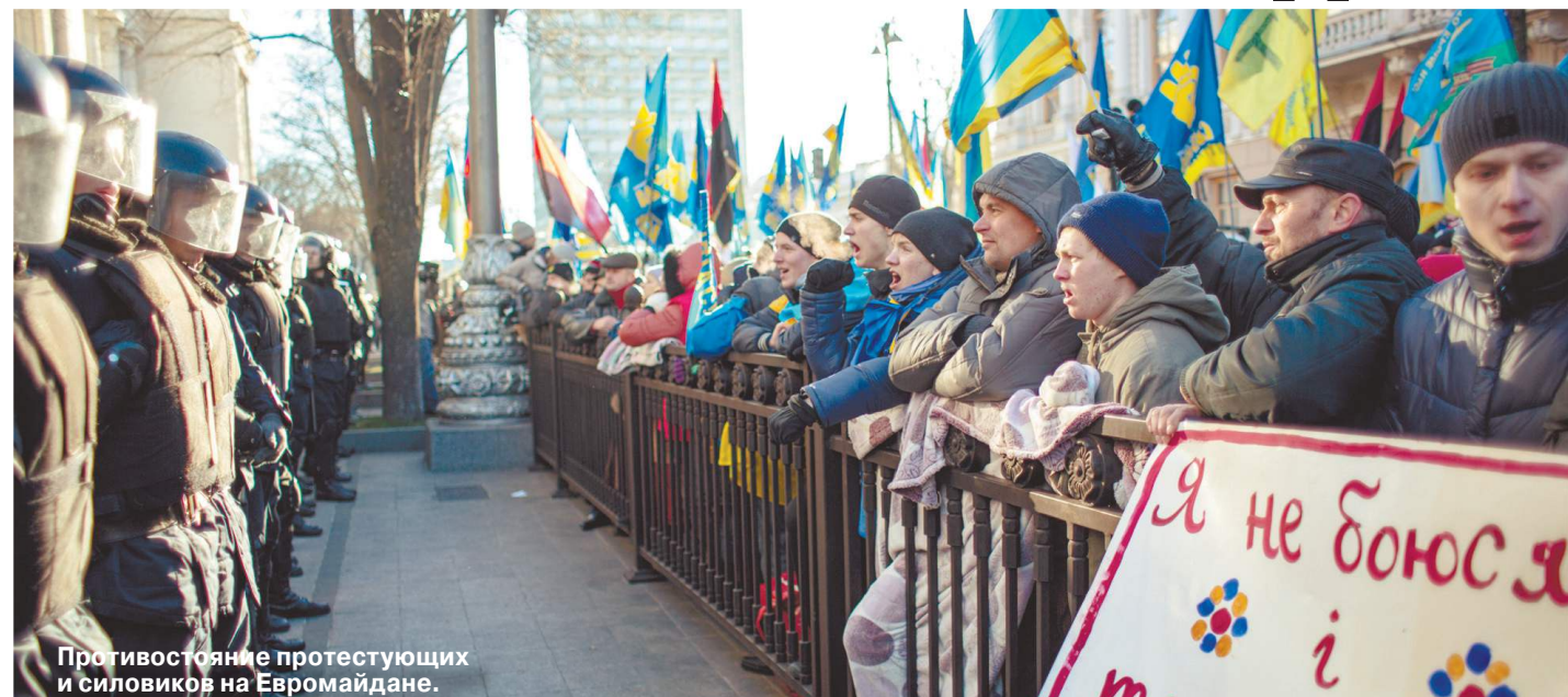
Противостояние протестующих и силовиков на Евромайдане.

В ночь на 30 ноября 2013 года в Киеве произошло событие, переболевшее ход истории Украины. Ваялая акция сторонников евроинтеграции на площади Независимости уже выдыхалась, когда власть сама