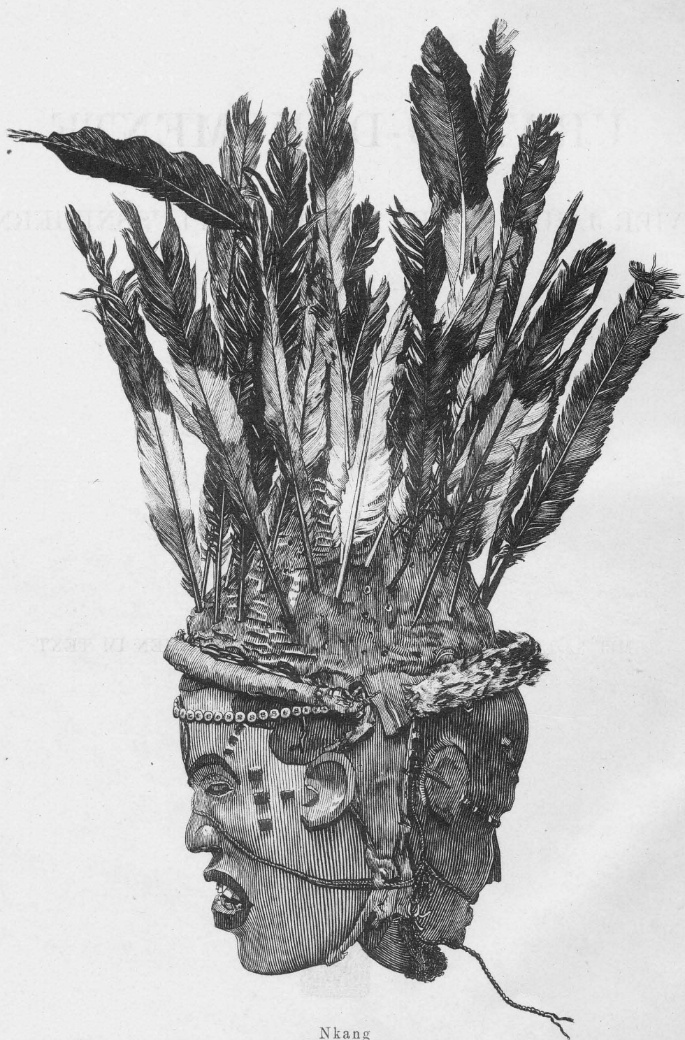
Nkang Tanzmaske der Crossfluss-Eingeborenen.