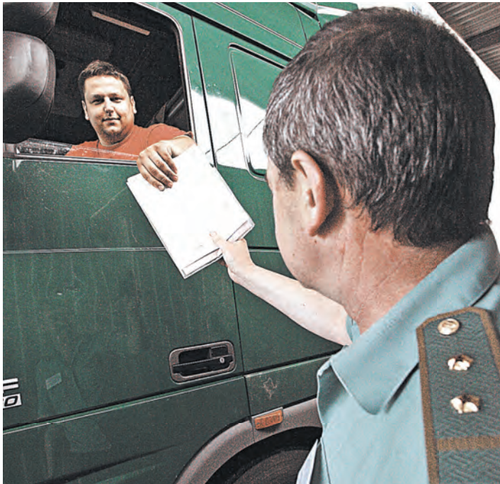
От Смоленска до белорусской границы всего 40 км. Пресс-тур начался с посещения Стабинского таможенного поста.

АНОНС / Прима витебского ансамбля «Лявониха» преподает хореографию детям из российской Рудни Так тянет танцевать!