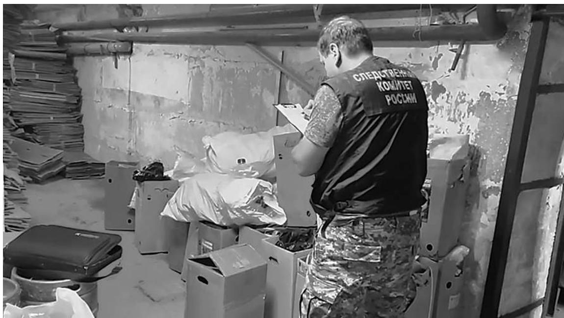
СЛЕДСТВЕННЫЙ КОМИТЕТ РФ

В Поволжье разбираются с последствиями массового отравления сидром