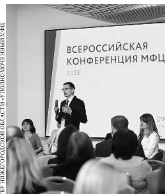
Участники предложили центрам соцразвития сотрудничать с МФЦ.

— В Нижегородской области мы уделяем большое внимание и обучению граждан пользованию цифровых услуг. В рамках проекта «Доступно, открыто, понятно» обучаем желающих компью-