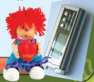
Иллюстрация на обложке: Buena Vista Sony Pictures Releasing © Disney. All Rights Reserved