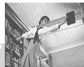
Кадр 3. Сложности расстановки книг. («Мумия»).