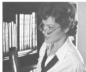
Кадр 2. Очаровательный библиотекарь Эвелин (Рейчел Уайз «Мумия»).

«Типичная» библиотекарша из «Охотников за привидениями» встречается в фильмах не так часто, как может показаться. Зарубежные кинематографисты предпочитают, по крайней мере в качестве главных героинь, более молодых и привлекательных представительниц данного профессионального сообщества. Это дает возможность развития романтической линии повествования. Кто сможет устоять, когда перед ним девушки не толь-