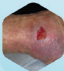
23.03.15 Грануляция раны