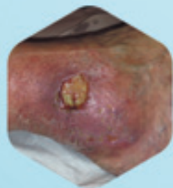
09.02.15 Начало терапии

Абсорбирующая губчатая повязка с гидроактивным гелевым покрытием. В фазах грануляции и эпителизации.