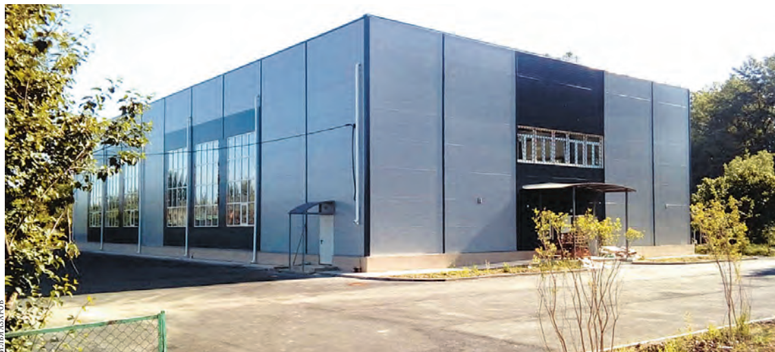
Спортивный комплекс шаговой доступности «Кубанский» — одна из новостроек 2021 года.

— Согласен, печи уходят в прошлое. В Новых Полянах нам удалось раньше срока ввести в эксплуатацию газораспределительную сеть протяженностью бо-