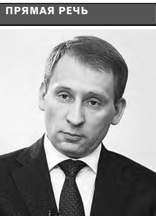
ПРЯМАЯ РЕЧЬ Александр Козлов, министр природных ресурсов и экологии РФ:

В аутсайдерах «зеленого рейтинга» оказался Краснодар, значительно уступив другим мегаполисам. Доля зеленых насаждений составила всего 8,1 процента. «Население города и края стремительно увеличивается из-за миграционного притока, которому способствуют теплый климат и широкие возможности для ведения бизнеса. Безусловно, древесной растительности этому южному городу не хватает», — отмечается в исследовании Роскосмоса. ●