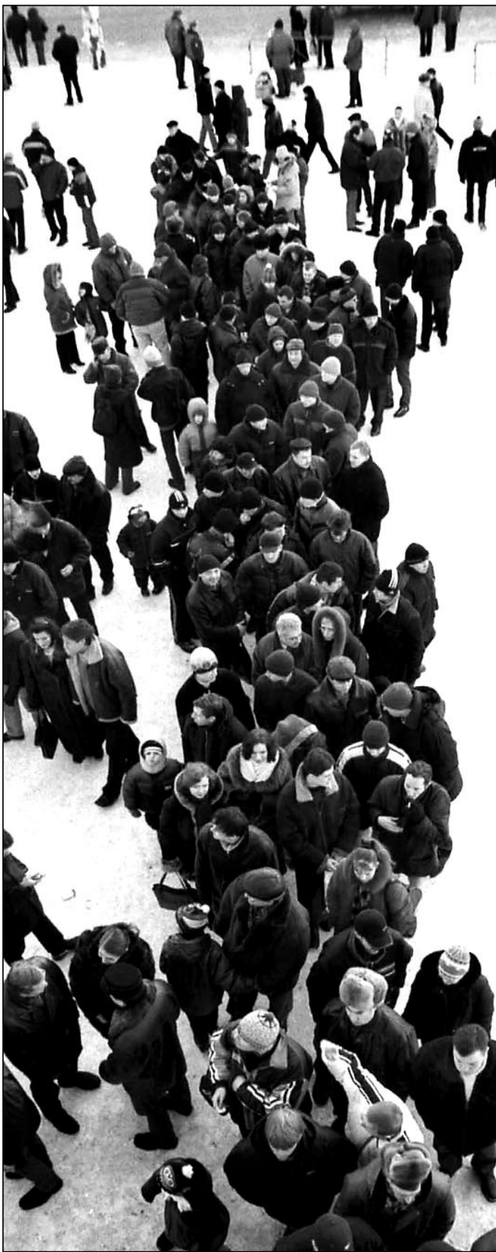
Суббота. Санкт-Петербург. Кассы Ледового дворца давно не видели такого наплыва болельщиков.