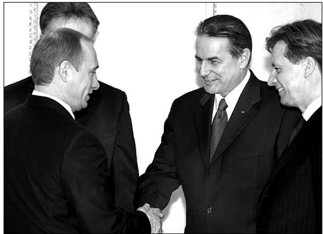
Суббота. Москва. Кремль. Президент России Владимир ПУТИН и президент МОК Жак РОГГЕ.