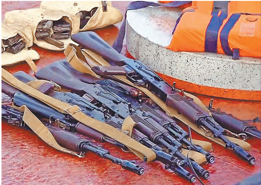
Вот этот арсенал «Калашниковых», а еще крупнокалиберные пулеметы ДШК обнаружила досмотровая группа пограничников после задержания украинского буксира «Яны Капу».