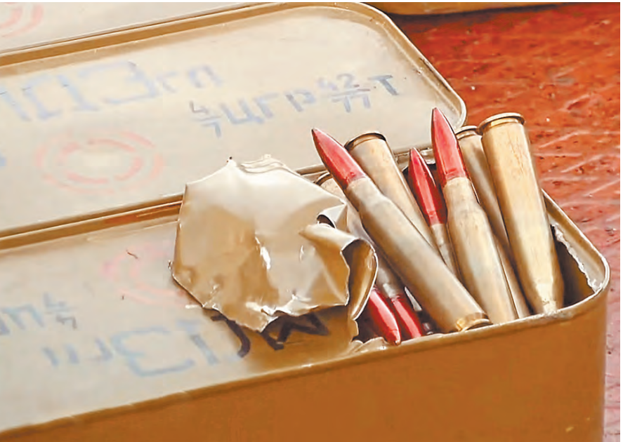
Был также обнаружен и полный боекомплект патронов калибра 12,7 мм для крупнокалиберного пулемета ДШК, который предназначен для поражения легкобронированных целей.