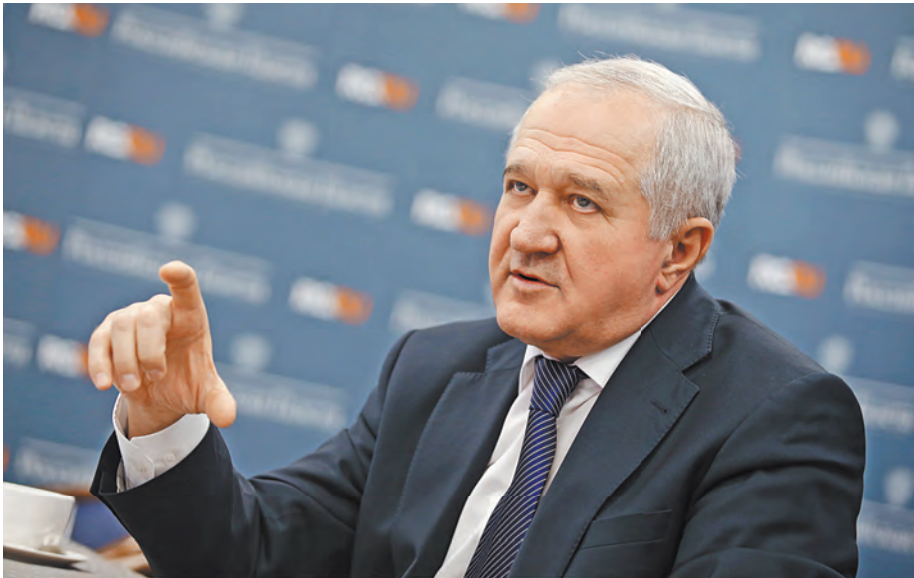
Владимир Булавин: 80% таможенных деклараций выпускаются полностью в автоматическом режиме.

ФИНАНСЫ Что будет с процентами по банковским вкладам после повышения ключевой ставки