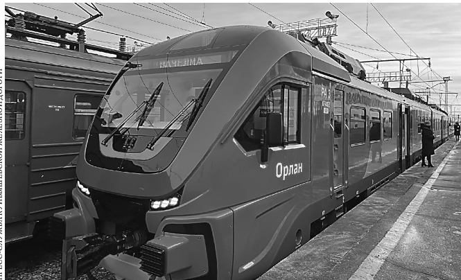
Курсировать рельсовый автобус будет ежедневно.