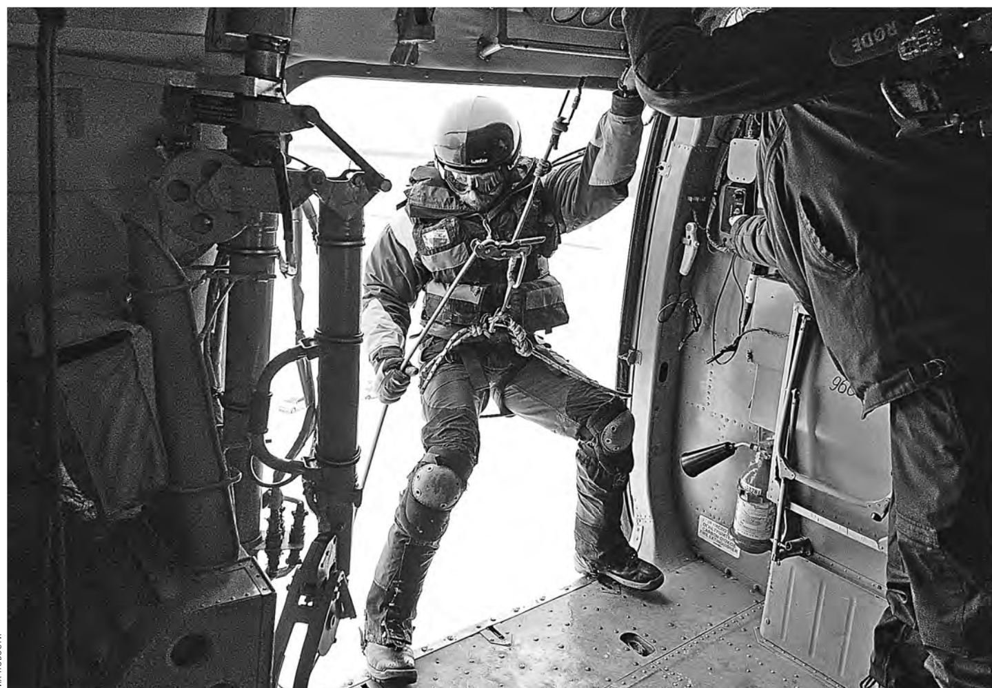
МЧС закупает экипировку и технику только российского производства, за исключением тех вещей, которых наша промышленность не выпускает.