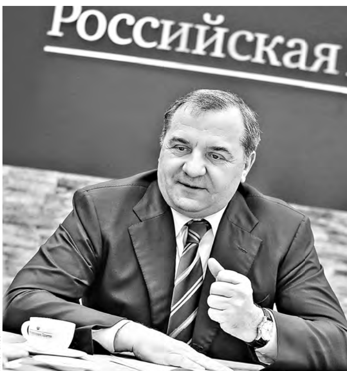
Министр по чрезвычайным ситуациям Владимир Пучков за чашкой чая поговорил с нами и о погоде тоже.

от первого лица Зачем к Институту питания РАН присоединили несколько научных коллективов