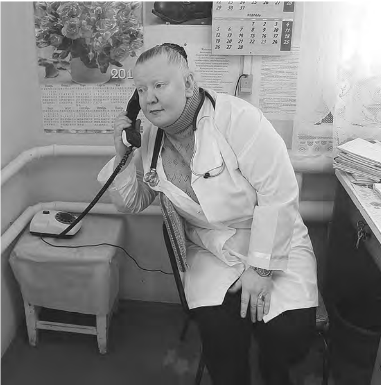
РЕГИОНАЛЬНОЕ ОТДЕЛЕНИЕ ОНФ В ЯРОСЛАВСКОЙ ОБЛАСТИ