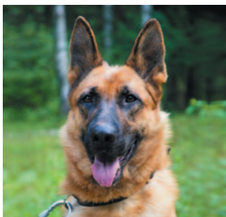
Карма, немецкая овчарка, 2 года