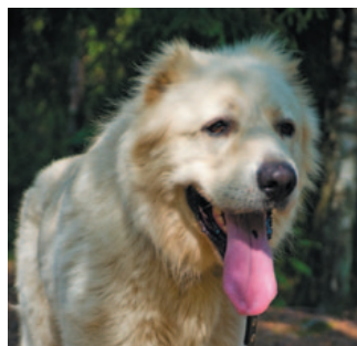
Полкан, кавказская овчарка, 2 года