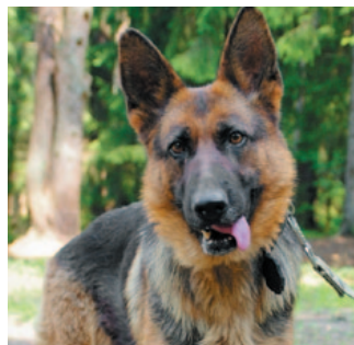
Челси, немецкая овчарка, 2 года