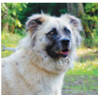
Рада, метис, 3 года