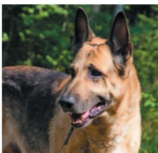
Чарли, восточно- европейская овчарка, 6 лет