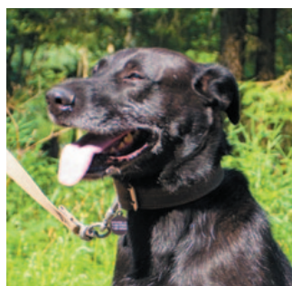
Рекс, метис, 2 года