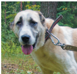
Гайне, средне- азиатская овчарка, 5 лет