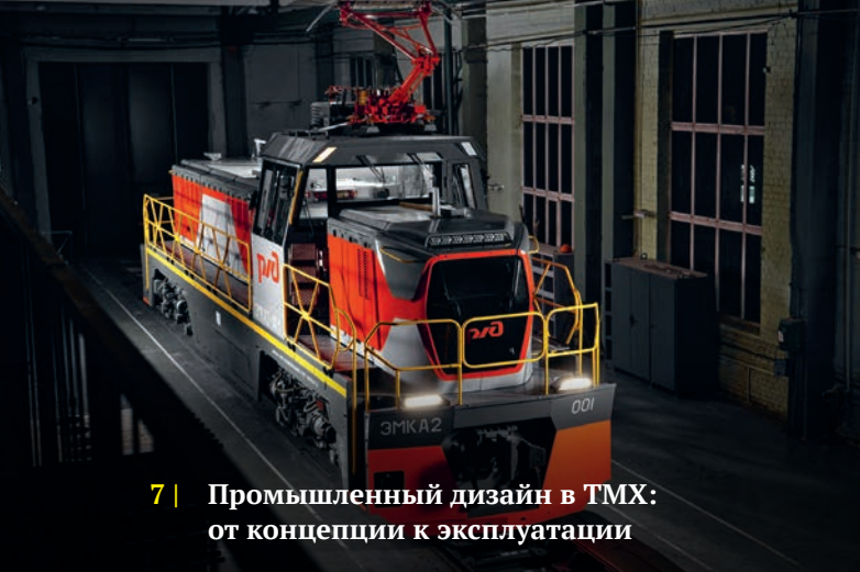
7 | Промышленный дизайн в ТМХ: от концепции к эксплуатации