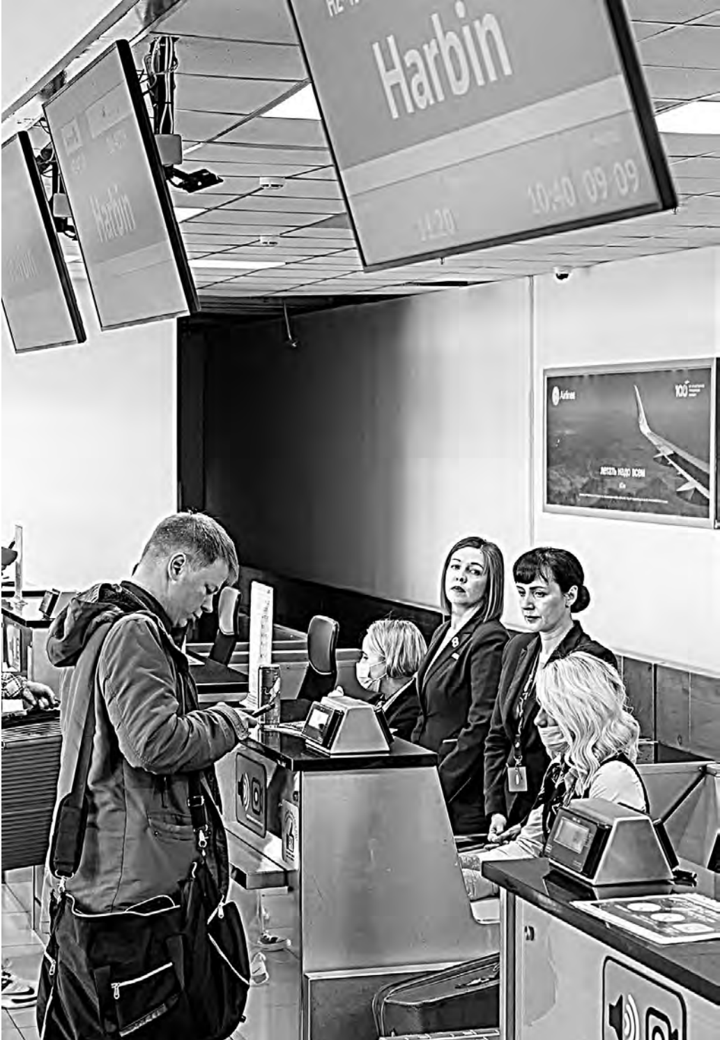
На первый рейс из Владивостока в Харбин зарегистрировались около 80 человек.

Следующим дальневосточным регионом, который возобновляет авиасообщение с Китаем, стала Республика Саха (Якутия). С 6 апреля самолеты авиакомпании «Якутия» начнут выполнять еженедельные перелеты из столицы региона в Харбин. Купить билеты можно уже сейчас.