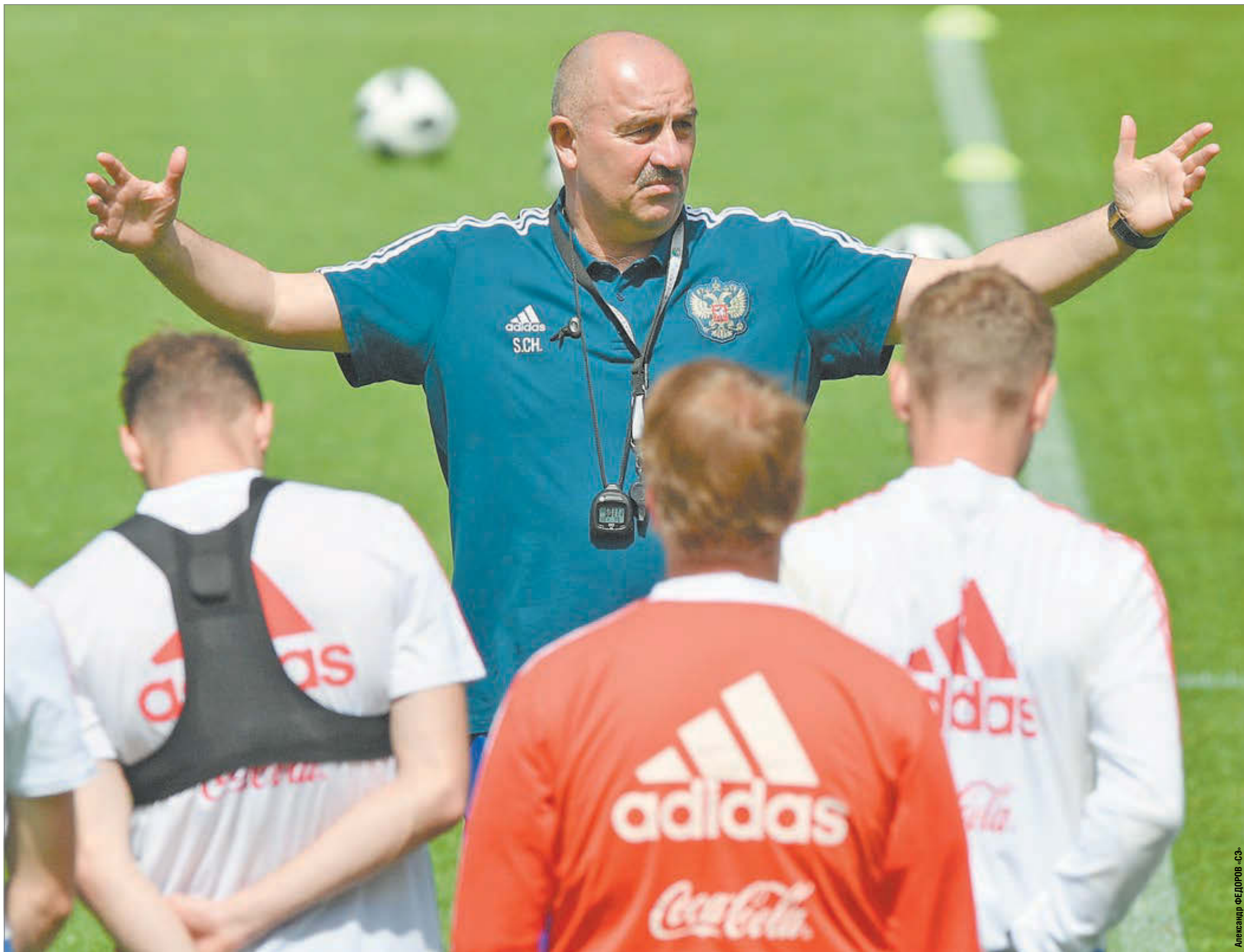
Усилил ли новый лимит сборную России? На фото - главный тренер национальной команды Станислав ЧЕРЧЕСОВ.

Вчера исполком РФС официально принял ключевое решение, о котором разговоры велись уже давно: с сезона-2020/21 лимит в РПЛ будет «8 легионеров+17 россиян» в заявке на чемпионат. Эта система сменит действующую формулу «6+5» на поле.