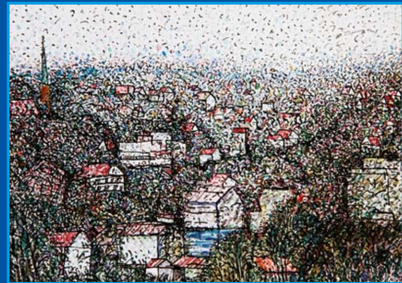
ГОРОД МОСС. НОРВЕГИЯ. Бум., акв., тушь