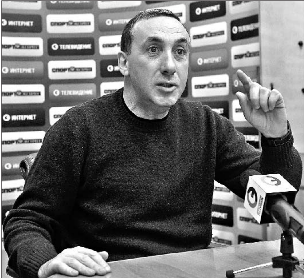
Вчера. Президент ЦСКА Евгений ГИНЕР в редакции «СЭ».

Один из самых талантливых хоккеистов России, лидер прошлогоднего финалиста плей-офф КХЛ «Трактора», который так и не смог вписаться в олимпийскую сборную страны, в Челябинске дал откровенное интервью