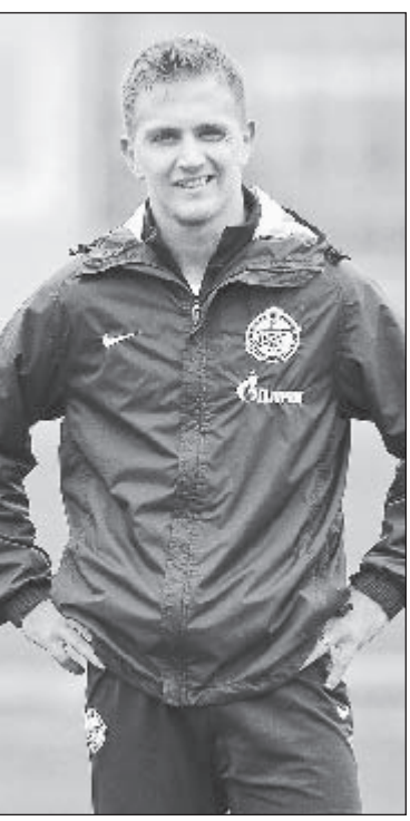
Внезапно ЕВРОКУБИКОВ