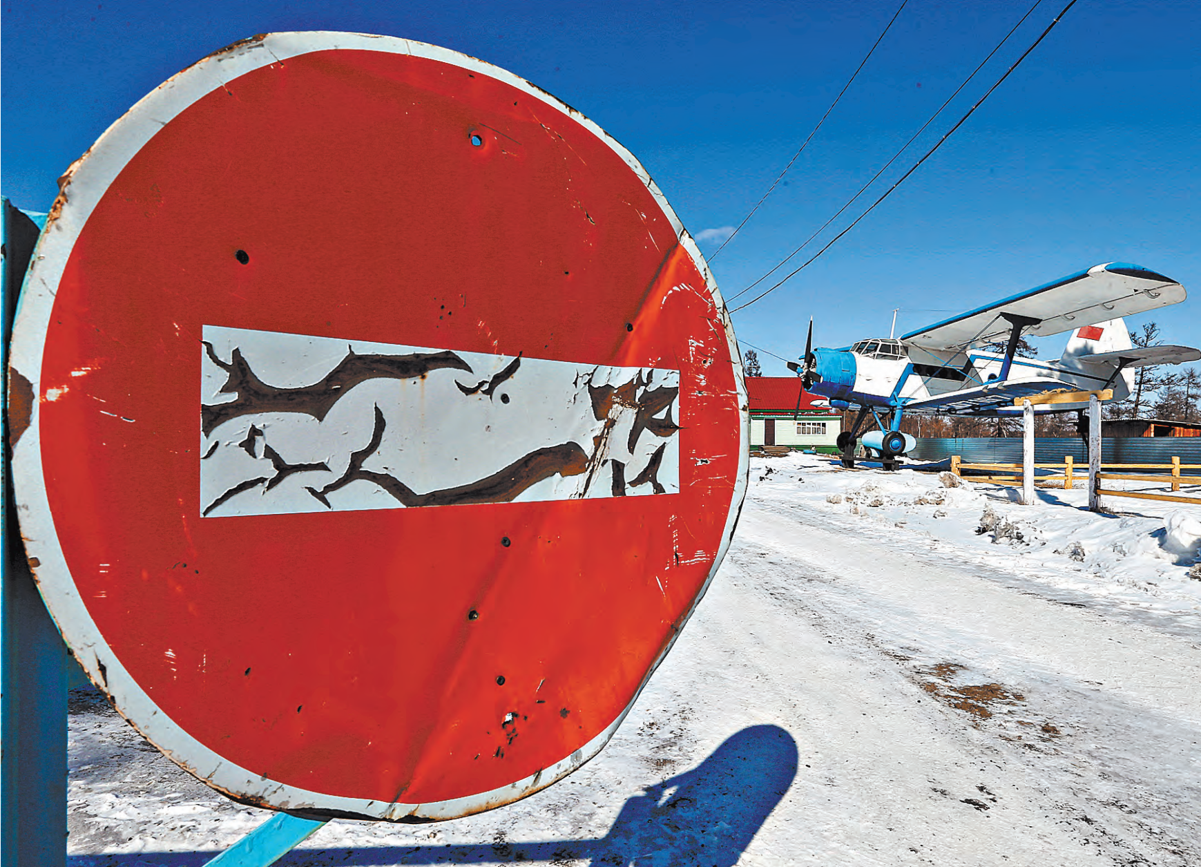
Безопасность полетов и большой, и малой гражданской авиации начинается на Земле.

ВАЛЕРИЙ ШЕЛКОВНИКОВ: Они нормируют возможную частоту авиационных происшествий. Нормы летной годности одинаковы для самолетов любой пассажировместимости и составляют примерно 10^{-7} на час полета. Однако и их можно выполнять по-разному. Да, есть человеческий фактор, по вине которого происходит до 80 процентов авиационных происшествий. Как правило, всех со-