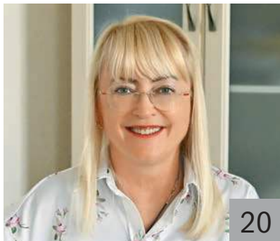
И. В. КИВИКО, заместитель председателя Совета министров Республики Крым — министр финансов