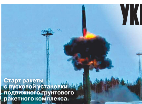
Старт ракеты с пусковой установки подвижного грунтового ракетного комплекса.