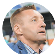
Андрей Тихонов, восьмикратный чемпион России в составе «Спартак»