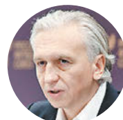
Александр Дюков, президент РФС