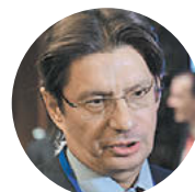
Леонид Федун, владелец «Спартак»