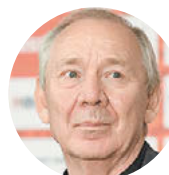
Олег Романец, самый титлованный тренер в истории «Спартак»

Человечище! Личность. Яркий. Он был ярким во всем, во всех своих проявлениях.