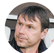
Егор Титов, шестикратный чемпион России в составе «Спартак», первый титул взял в 1996 году под руководством Георгия Ярцева