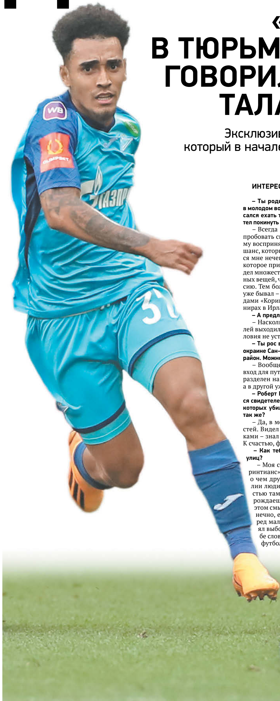
Суббота. Казань. «Зенит» – ЦСКА – 0:0 (пен. – 5:4). В атаке – Ду Кейрос