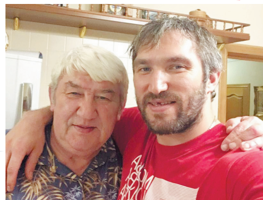
БЕДА В СЕМЬЕ АЛЕКСАНДРА ОВЕЧКИНА Скончался отец знаменитого хоккеиста Читайте 3-ю стр.