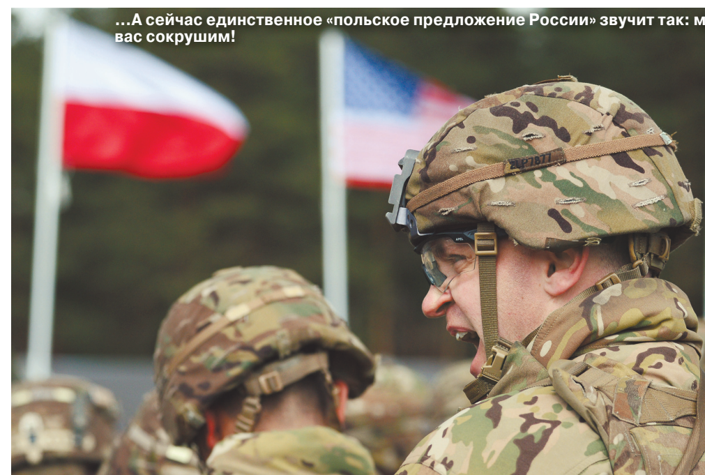
...А сейчас единственное «польское предложение России» звучит так: мы вас сокрушим!

Как Польша планирует создать в центре Европы неформальную империю с населением в 100 миллионов человек