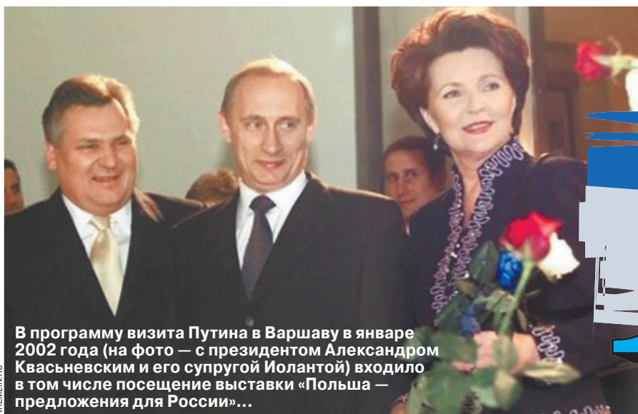
В программу визита Путина в Варшаву в январе 2002 года (на фото — с президентом Александром Квасьневским и его супругой Иолантой) входило в том числе посещение выставки «Польша — предложения для России»...