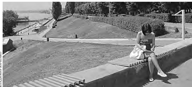
Скоро одиночные прогулки саратовцев останутся в прошлом.

По официальным данным, около 4 тысяч саратовцев заболели коронавирусом, более полутора тысяч жителей уже выздоровели, скончались свыше ста человек инфицированных, в том числе непосредственно от COVID-19 – 36 человек.