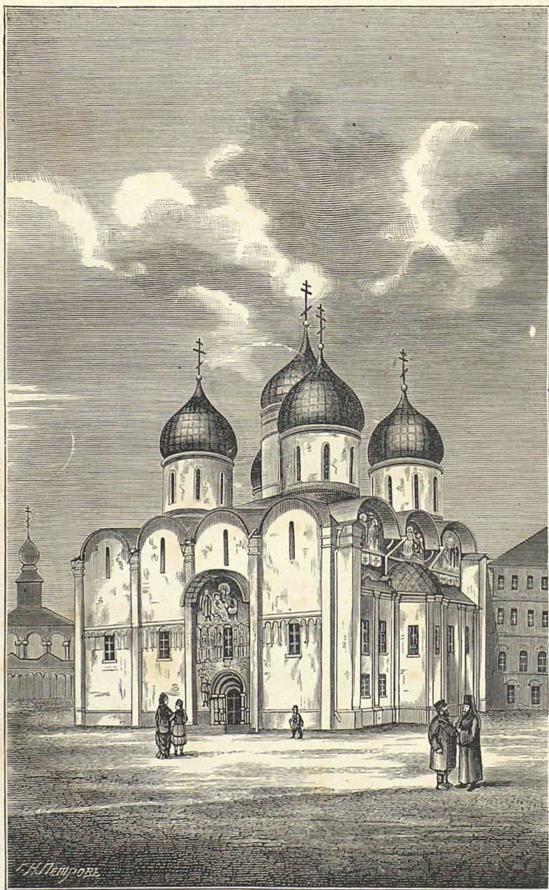
Московский Большой Успенский Соборъ.